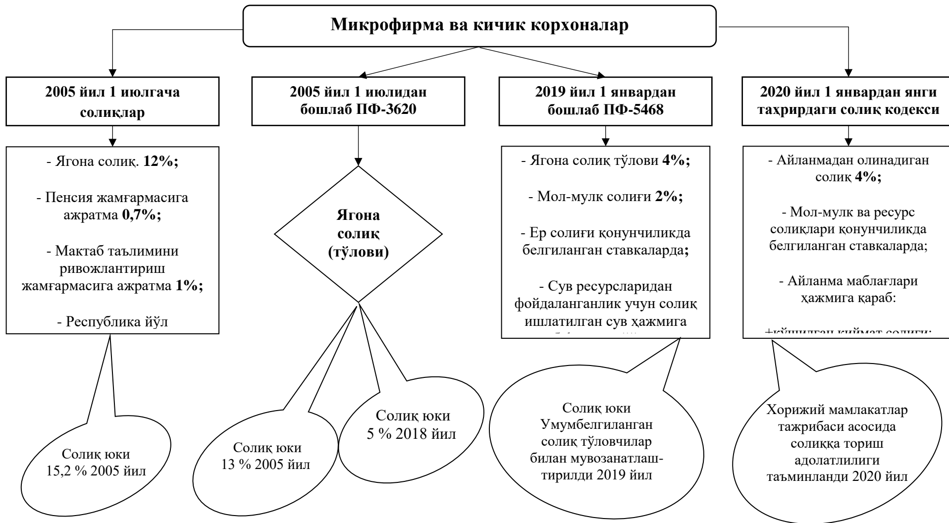
2-расм. Ўзбекистонда микрофирма ва кичик корхоналарда солиқ юкининг ўзгариши 3 .